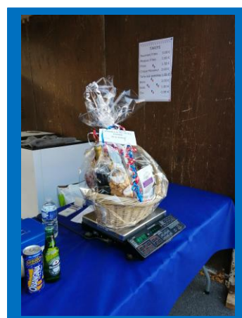
Panier garni 8.07 Kg

La fête a connu une belle participation, samedi la bonne humeur était au rendez-vous.